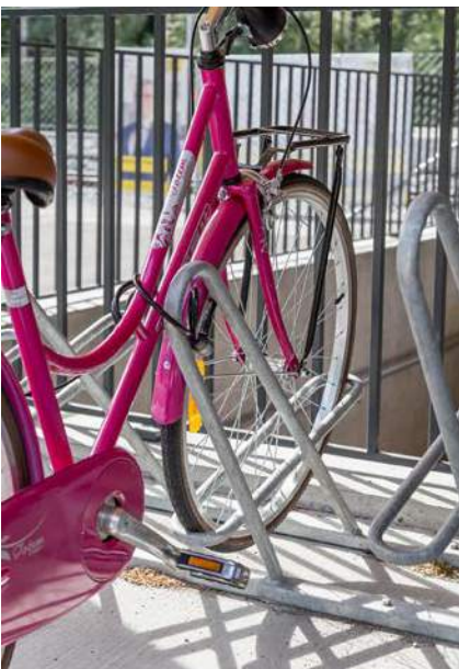
Supports à vélos pour une utilisation aisée et fréquente.