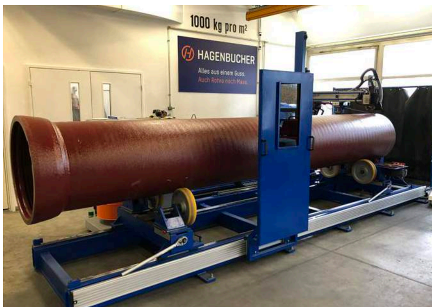
... et l'unité de soudage : tout ça se trouve auprès de notre centre de compétences à Eglisau