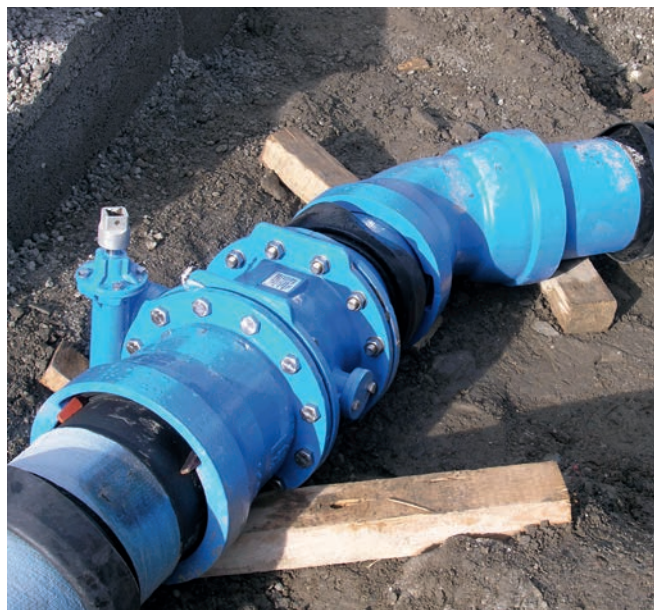
Un montage ou démontage simple et rapide grâce au système flexible de l'emboîtement auto-étanche VRS-T pour tuyaux, raccords et robinetterie.