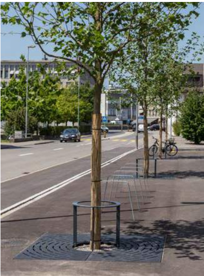
Les systèmes de protection d'arbre jouent aussi un rôle déterminant dans la réalisation et la plantation urbaine pour des espaces de circulation sans obstacles (à gauche).

TMH Thomas Hagenbucher AG s'occupe également des différents aspects de conception dans l'espace public. En font partie des systèmes de protection d'arbre, des systèmes de barrage, des récipients à ordures, des bancs et des supports à vélos. Avec l'introduction « espaces de circulation sans obstacles »(HV) notre assortiment d'aménagement a été adapté aux différents besoins : Les personnes en situation de déficit visuel ou à mobilité réduite peuvent se déplacer et se repérer plus librement dans les espaces publics, grâce à l'adaptation technique des aménagements.