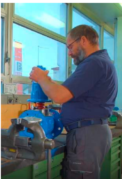
Notre propre atelier de service...