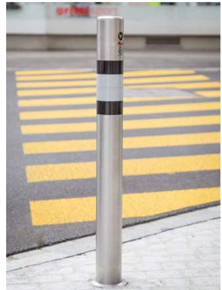
Systèmes de barrage : minimiser le danger, diriger le trafic, limiter les accès.