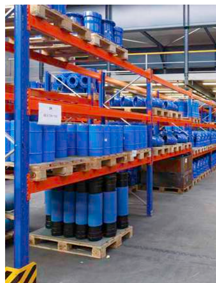
Un aperçu dans notre vaste magasin de raccords en fonte.