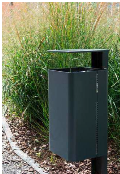
Récipients à ordures: L'alliance parfaite du design et de la fonctionnalité.