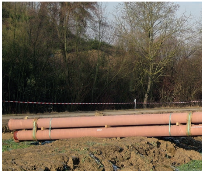
Les tuyaux FZM sont en service pour l'eau potable (bleu) ainsi que pour les eaux usées (brun rouge).