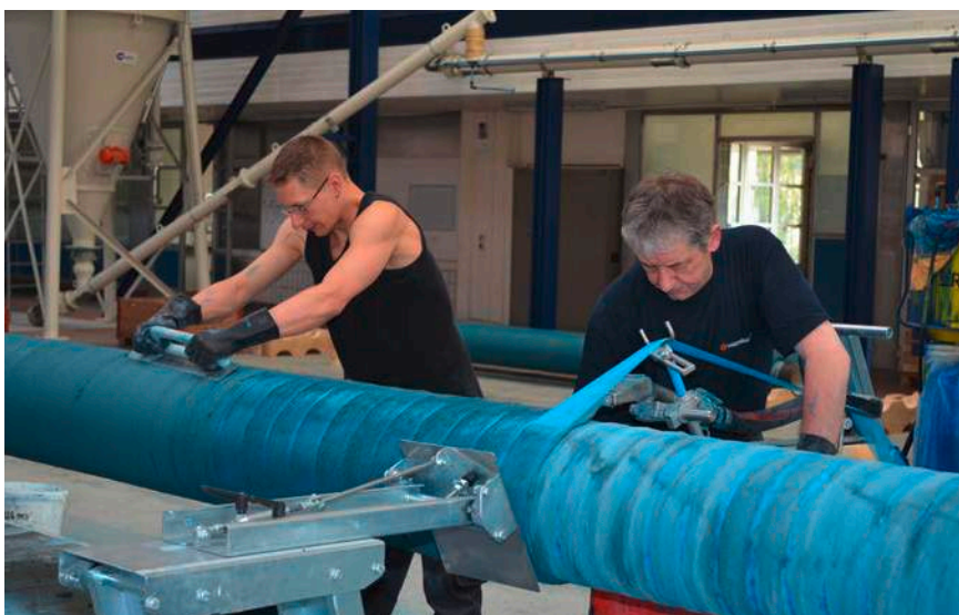
Application du mortier de fibrociment (FZM) par l'unité de revêtement.

À Eglisau se trouve notre magasin bien fourni, l'unité pour l'application du revêtement FZM, le soudage et notre propre atelier de service. Le site d'Eglisau comprend aussi une vaste salle de formation et une salle d'exposition. Ici se déroulent la journée professionnelle Hagenbucher et les cours de formation très appréciés pour la pose de tuyaux.