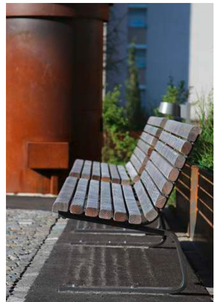
Bancs pour toutes les générations et leurs besoins.