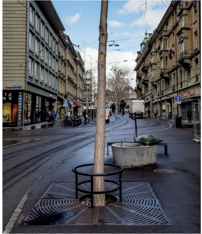
Stammschutzring Typ7 HV auf Baumrost Rondello 1.0