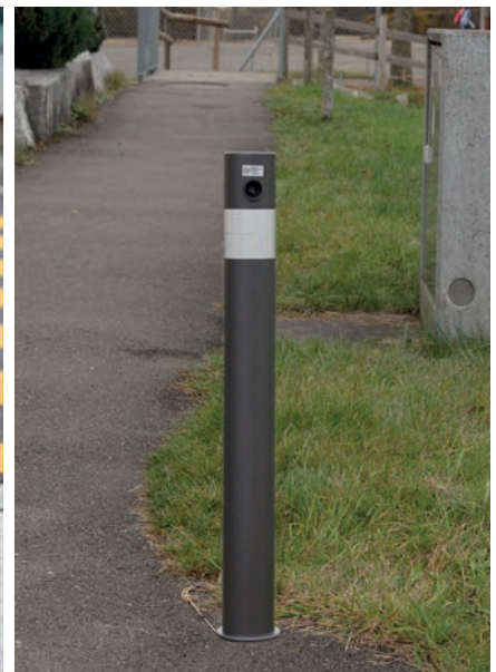
Nusser BECKmax HV