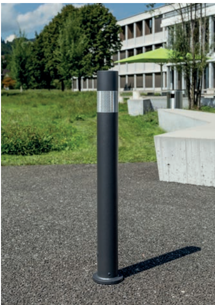
Fehr Poller HV

Die Absperrpfosten HV müssen im Vergleich zu den üblichen Absperrpfosten eine längere Bauhöhe haben und im Durchmesser grösser ausgebildet werden. Auch die optimierte Visualisierung ist entscheidend für Personen mit eingeschränkter Sehstärke. Die Pfosten sind entsprechend gefertigt und weisen eine kontrastreiche Oberfläche auf. Verschiedene Varianten mit diversen Kopfformen und Bauarten stehen zur Verfügung und lassen sich so für die unterschiedlichsten Standorte einsetzen.