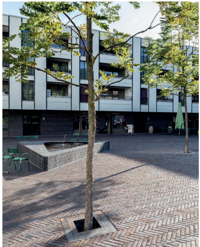
Unterflur-Baumrost mit Verjüngung an Stammöffnung