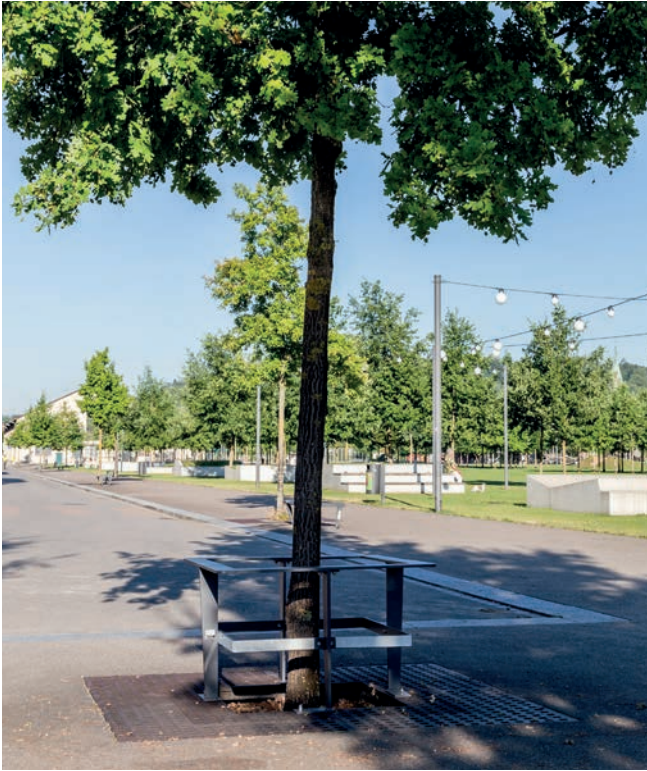
Stammschutzring Typ8 HV auf Baumrost Quadral 1.0