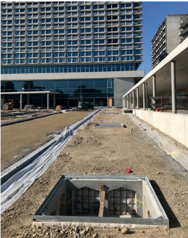
Baumpflanzquartier für Baumroste