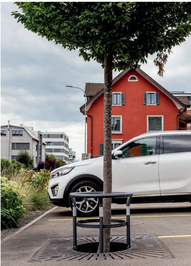
Stammschutzring Typ7 HV auf Baumrost CL2.0

Baumroste im öffentlichen Raum werden mit Rollstühlen und Rollatoren befahren oder mit den schmalen Abtastspitzen der Blindenstöcke taktil erfasst. Damit dabei keine Probleme entstehen, werden die Gussbaumroste mit schmalen Schlitzfenstern (kleiner als 13 mm) gefertigt. Die dafür neu erstellten Gussmodelle sind aufwändig in der Produktion und stellen unsere Giesserei vor eine gewisse Herausforderung. Doch das macht unsere Arbeit ja so spannend! Kombiniert mit klassischen Stammschutzelementen (taktil erfassbar durch den unteren Stahlring) können Bäume weiterhin optimal gepflanzt und mit ausreichend Wasser und Sauerstoff versorgt werden. Die Baumroste lassen sich natürlich wie gewohnt mit unseren Baumpflanzquartieren aus Beton kombinieren. Als Alternative zu Baumrosten aus Guss können auch Unterflur-Baumroste einen guten Dienst erweisen. Sie werden mit einem geeigneten Belag (Asphalt, Steinplatten etc.) überdeckt.