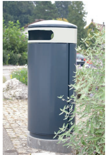
A76 mit weissem Einwurfring