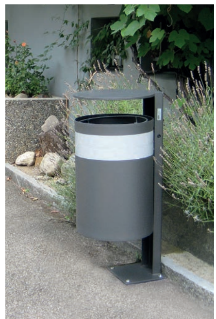
A13 mit Dach und weissem Ring