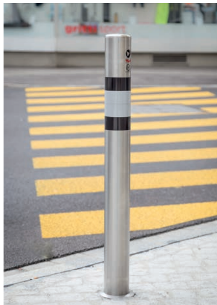
INOX TMH HV