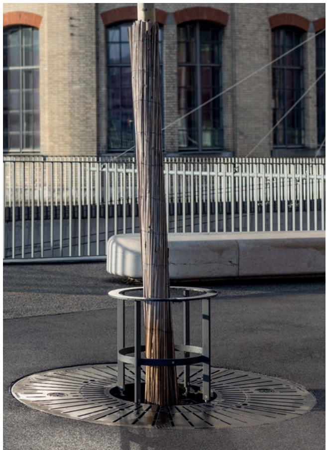
Stammschutzring Typ9 HV auf Baumrost CL2.0