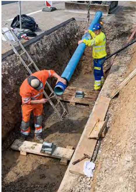
Das Gussrohr mit DN 150 wird für den Einzug via Berstlining-Verfahren vorbereitet.

Zu beachten galt es ausserdem, dass die generelle Wasserversorgungsplanung (GWP) eine Kalibervergrösserung von DN 100 auf DN 150 vorsah und seitens der