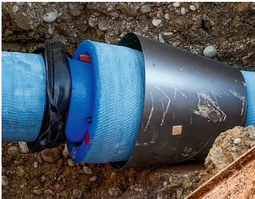
Das CEMPUR -Rohr mit der montagefreundlichen BLS-Verbindung eignet sich auch für den grabenlosen Rohrleitungsbau ideal.

Wir bedanken uns bei allen Beteiligten für das entgegengebrachte Vertrauen und die gute Zusammenarbeit.